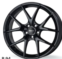
P 94 czarny 18-20 cali