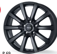
P 69 czarny matowy 15-18 cali