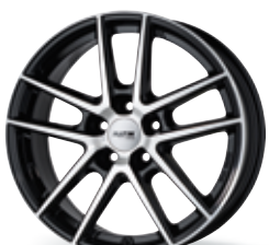
P 73 czarny, polerowany 15-18 cali