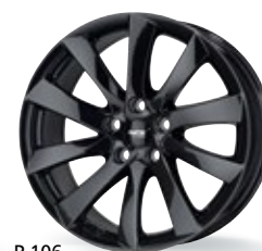
P 106 czarny 18-19 cali