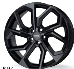
P 97 czarny 16-20 cali