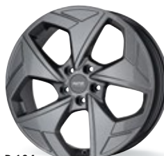
P 104 szary 19 cali