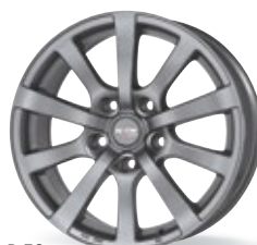
P 58 szary 15-18 cali