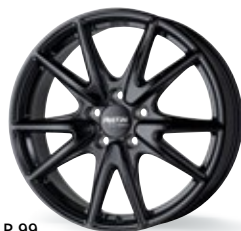
P 99 czarny 17-19 cali