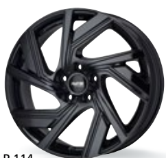
P 114 czarny 18-20 cali