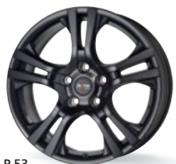
P 53 czarny matowy 15-16 cali