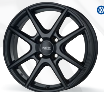
czarny matowy - 4-otworowy