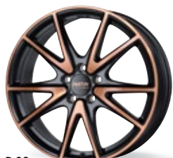
P 99 czarny miedziany mat 18-19 cali