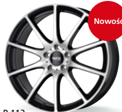
P 113 czarny, polerowany 19-20 cali