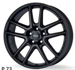
P 73 czarny matowy 15-18 cali