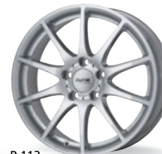
P 113 srebrny 16-18 cali