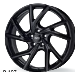
P 107 czarny 19 cali