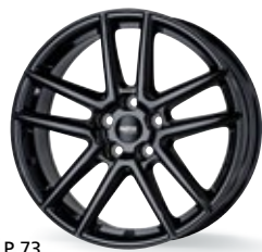
P 73 czarny 18-19 cali