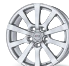
P 58 srebrny 15-18 cali