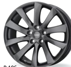
P 106 szary 18-19 cali