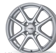
P 73 srebrny 14-16 cali 4-Loch