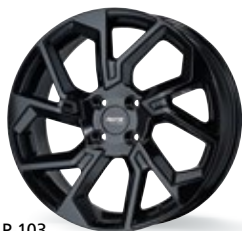
P 103 czarny 17-18 cali