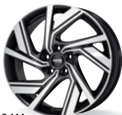
P 114 czarny, polerowany 18-19 cali