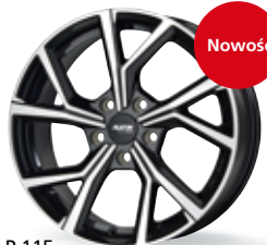
P 115 czarny, polerowany 16-18 cali