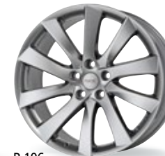
P 106 srebrny 18-19 cali