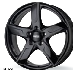
P 84 czarny 15-17 cali