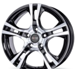
P 53 czarny, polerowany 15-16 cali