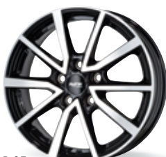
P 95 czarny, polerowany 16-17 cali