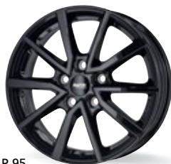
P 95 czarny 16-17 cali