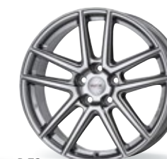
P 73 srebrny metaliczny 18-19 cali