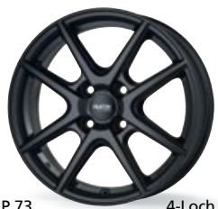
P 73 czarny matowy 4-Loch 14-16 cali