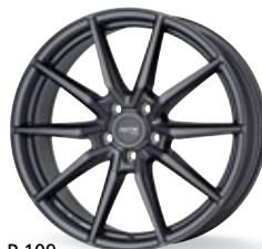
P 109 szary 18-19 cali