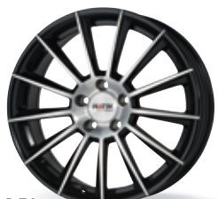
P 74 czarny, polerowany 17-19 cali