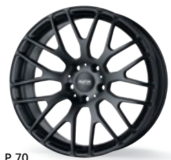
P 70 czarny matowy 18-19 cali