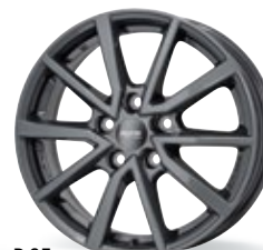
P 95 szary 16 cali