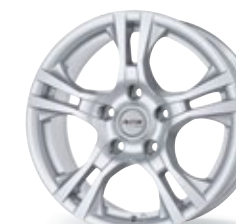
P 53 srebrny 15 cali