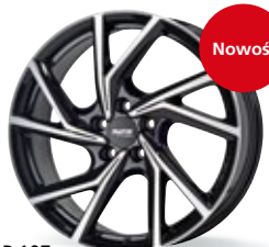
P 107 czarny, polerowany 19 cali