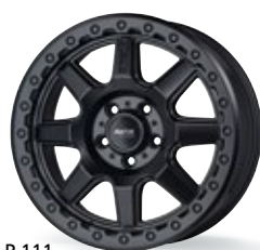
P 111 czarny matowy 18 cali