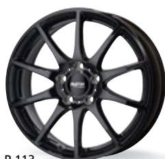
P 113 czarny 16-20 cali