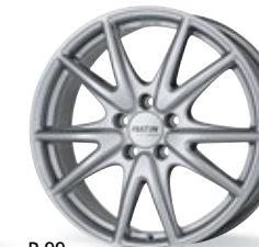
P 99 srebrny 17-19 cali