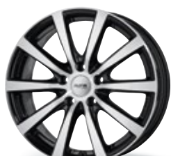
P 69 czarny, polerowany 15-18 cali