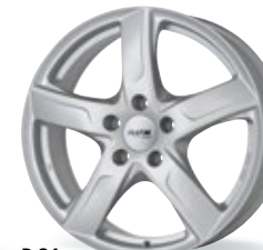
P 84 srebrny 15-17 cali