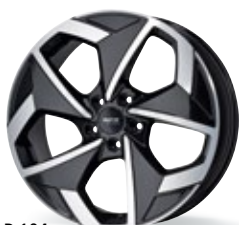
P 104 czarny, polerowany 18-19 cali