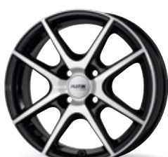
P 73 czarny, polerowany 14-16 cali 4-Loch