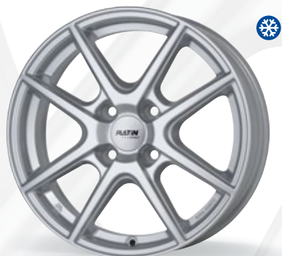
srebrny - 4-otworowy