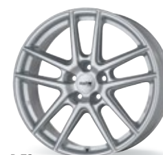
P 73 srebrny 15-18 cali