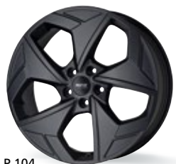
P 104 czarny matowy 19 cali