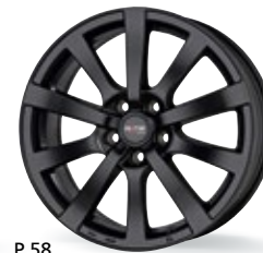
P 58 czarny matowy 15-18 cali