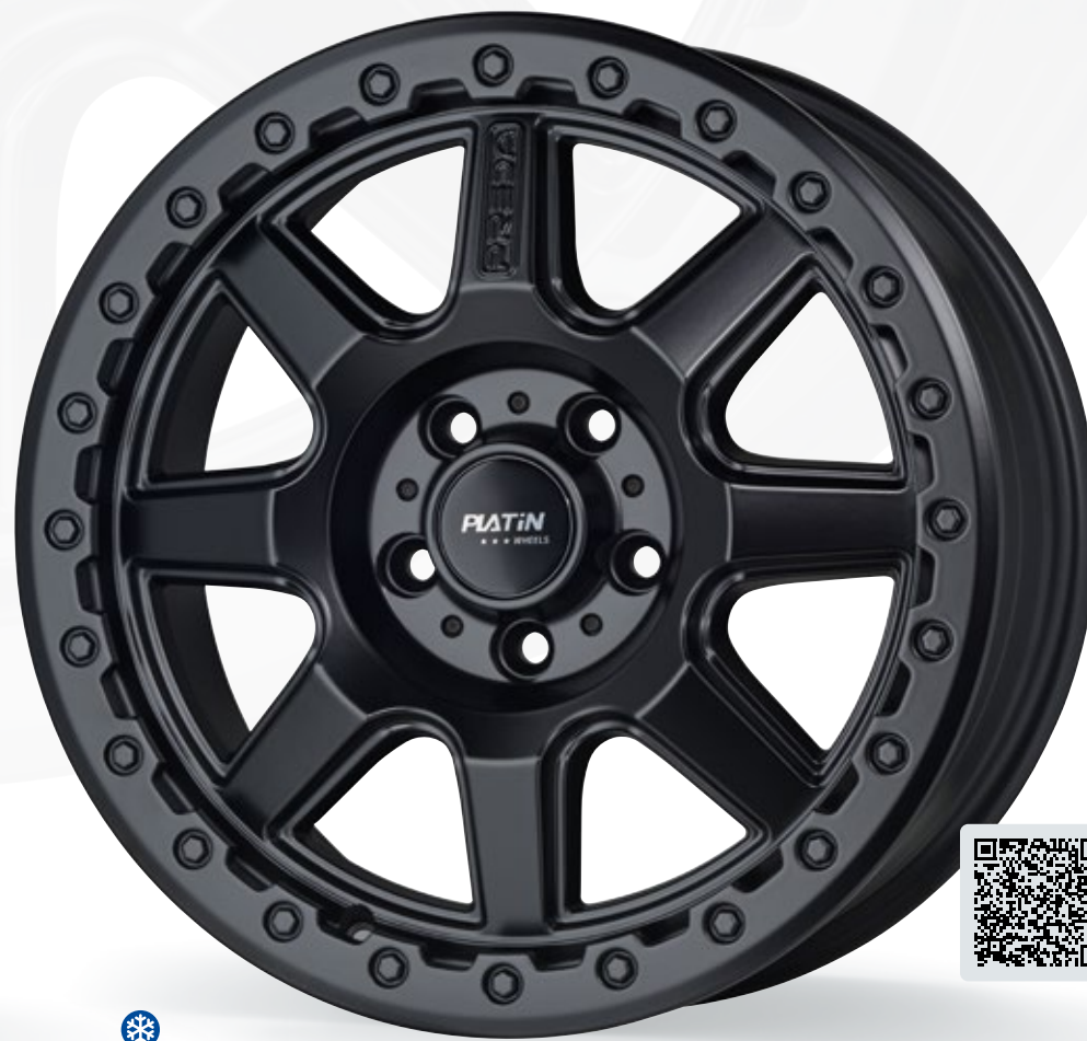
czarny matowy – 5-otworowy