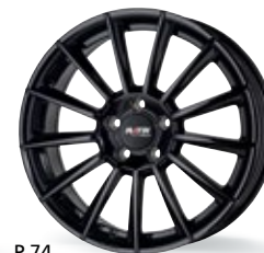
P 74 czarny 17-19 cali