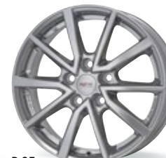
P 95 srebrny metaliczny 16-17 cali