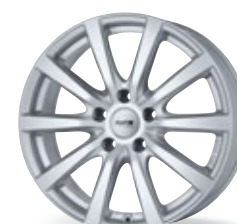
P 69 srebrny 15-18 cali