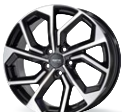
P 97 czarny, polerowany 16-20 cali