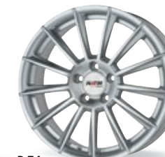
P 74 srebrny 17-19 cali