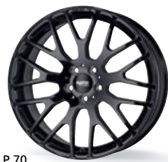
P 70 czarny 18-21 cali